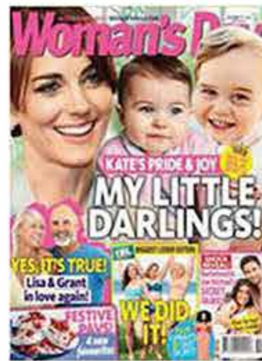
Woman's Day Circulation: 90,037