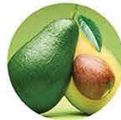
Aceite de aguacate orgánico