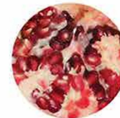
Aceite de semilla de granada orgánico