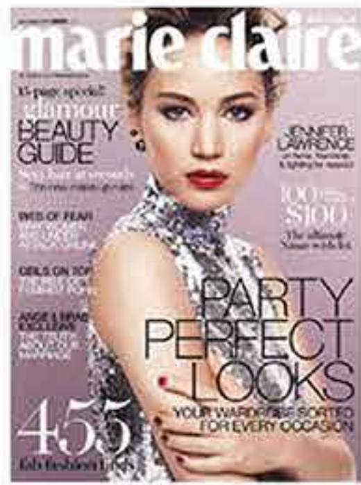
marie claire Circulation: 80,422

+45 millones de mujeres han visto a INIKA en publicaciones clave de alrededor del mundo.