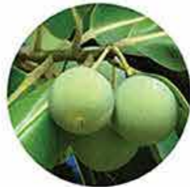
Aceite de Tamanu orgánico