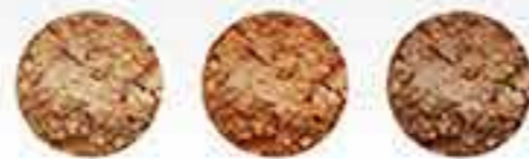
Sunlight Sunkissed Sunloving (New)