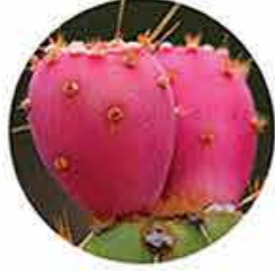
Higo chumbo orgánico