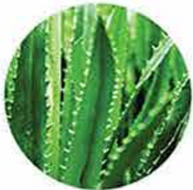
Aloe vera orgánico