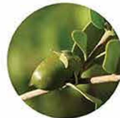
Aceite de jojoba orgánico