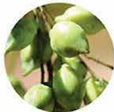
Ciruela kakadu orgánico