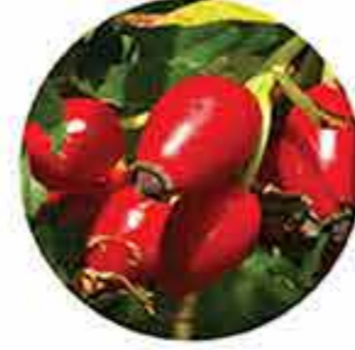
Aceite de rosa mosqueta orgánico