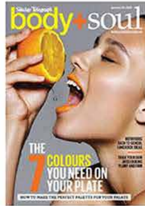
body+soul Circulation: 1,613,197

CRACKED LIPS Cracks in the corners of the mouth may be due to a deficiency of B vitamins, Evertz says, adding that they often flare up during periods of stress. "To help prevent this deficiency, include foods that are rich in vitamin B such as spinach, red meat, eggs, oily fish and mushrooms in your daily diet." Dry, cracked lips can occur at any time of year, not just winter. To stop them drying out, Evertz advises keeping well hydrated with at least two litres of water per day and always using lip care products that are free of emulsifiers, perfumes and preservatives. TRY Inika Certified Organic Ultimate Lip Balm ($25, 1000 765 302) is a certified organic vegan lip balm formulated with the essences of candillita and camu-camu as well as shea butter and coconut oil.