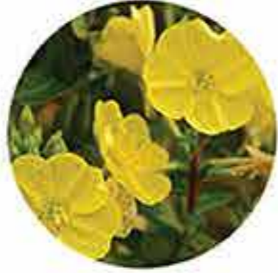
Aceite de onagra orgánico