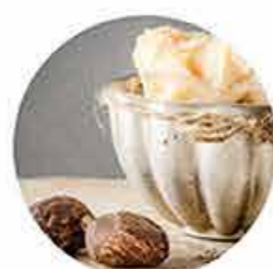
Manteca de karité orgánico