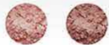
Pink Petal (New) Rosy Glow