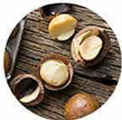
Aceite de macadamia orgánico