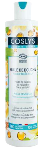
ACEITE DE DUCHA UVA