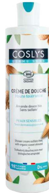
CREMA DE DUCHA ALMENDRAS