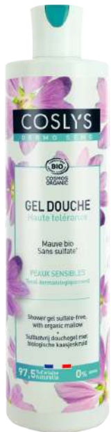
GEL DE DUCHA MALVA

Geles de ducha de diferentes texturas formulados sin sulfatos para las pieles más delicadas.