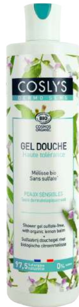
GEL DE DUCHA MELISA